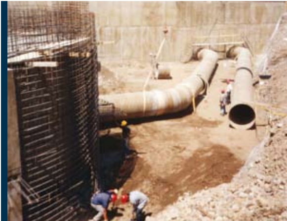
Planta La Farfana, Santiago Chile La Farfana Plant, Santiago Chile