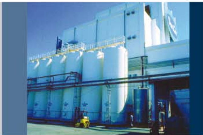
Tanques para condensado de 150 m 3 de capacidad 150 m 3 condensation tanks