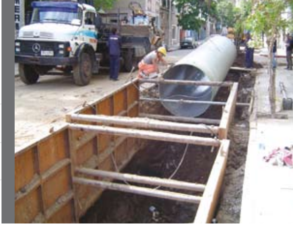
Alcantarillado Montevideo, Uruguay Montevideo Sewer System, Uruguay