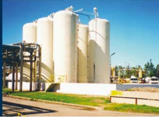
Tanques para ácido clorhídrico de 160 m 3 de capacidad 160 m 3 hydrochloric acid tanks