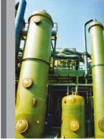
Columnas de proceso Process columns