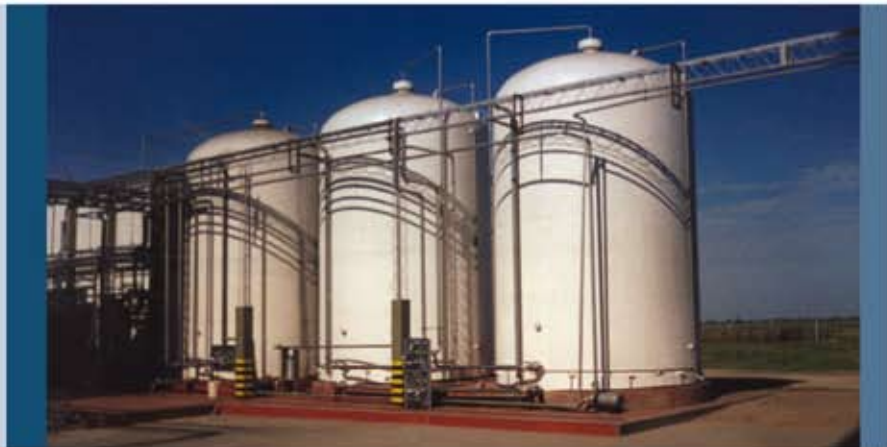
Silos de 80 m 3 para leche 80m 3 milk silos