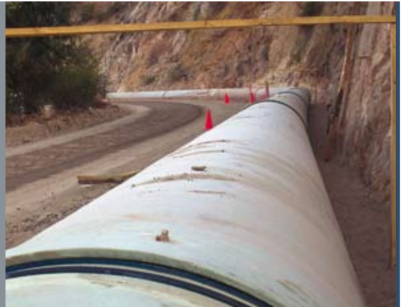
Planta de abatimiento de molibdeno El Teniente El Teniente Molybdenum Dejection Plant