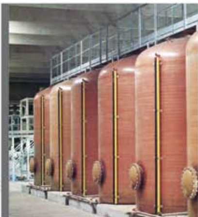
Tanques para almacenamiento de adhesivo Adhesive storage tanks