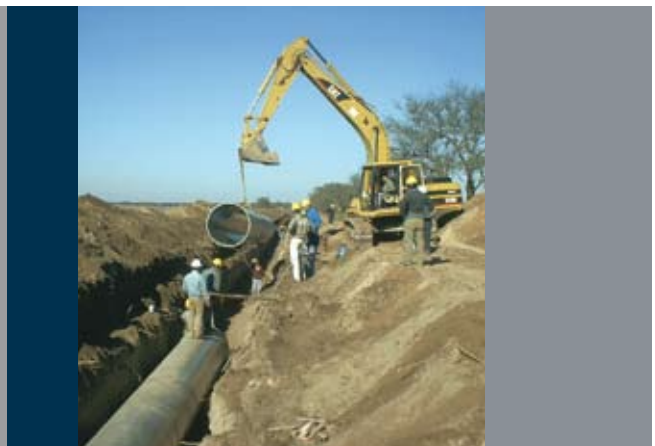
Acueducto Río Colorado, La Pampa Argentina Río Colorado Aqueduct, La Pampa, Argentina