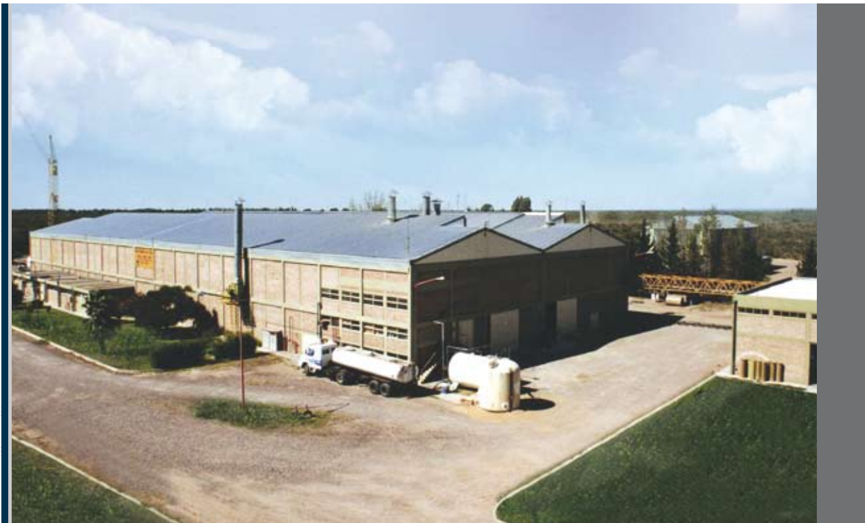
Planta Mendoza - Argentina

■ Its production plant is located in the province of Mendoza, Argentina, and it is the most modern one in South America. The production plant in Mendoza, together with the commercial offices in Buenos Aires, provides employment for more than 300 workers.