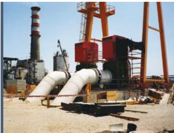
Central de Ciclo Combinado, Mejillones Combined Cycle Power Station, Mejillones