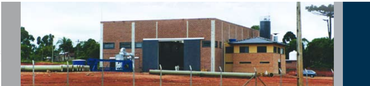
Planta Curitiba - Brasil

■ Petrofisa do Brasil was created in 1997 in the metropolitan area of Curitiba, Brazil, giving a greater presence to the group in South America.