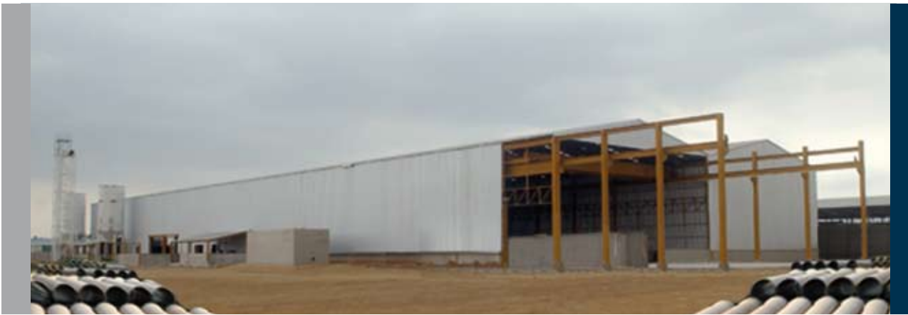
Planta - Guayaquil Ecuador

■ Grupo Petroplast grants a new license with its corresponding know how for the manufacture of FRP pipes up to 2.5 meters of diameter and 14 meters of length. The plan layout / floor plan is located in Guayaquil, Ecuador.