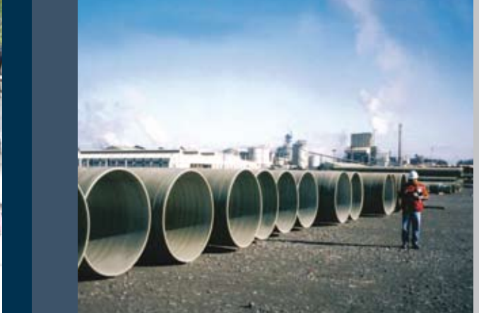
Planta celulosa Nacimiento CMPC Nacimiento Cellulose Plant, CMPC