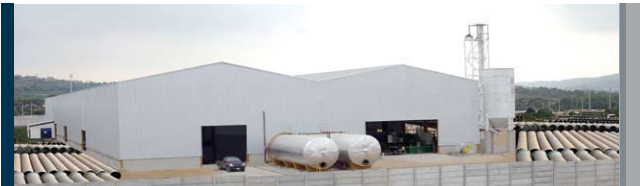
Planta - Guayaquil Ecuador