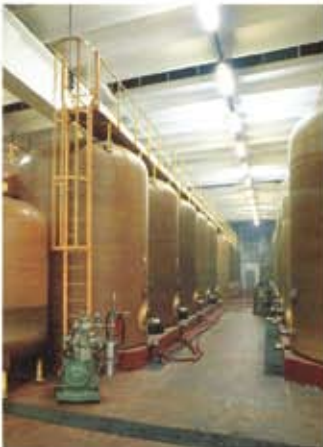
Tanques para vino Wine tanks