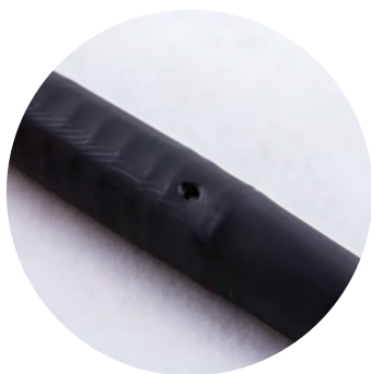
manguera redonda · rollos de hasta 600 m