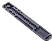
Gotero D2000 16mm