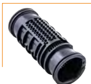
Gotero Hydro PCND 12mm y 16mm