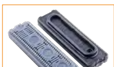
Gotero D5000 16mm