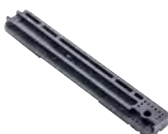
Gotero Hydrodrip 16mm